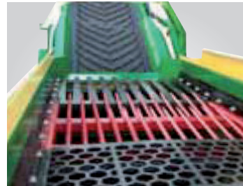
Siebkasten mit verschiedenen Belägen