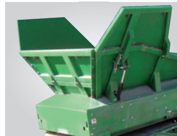
Seitenplatten zur Trichterhöhung